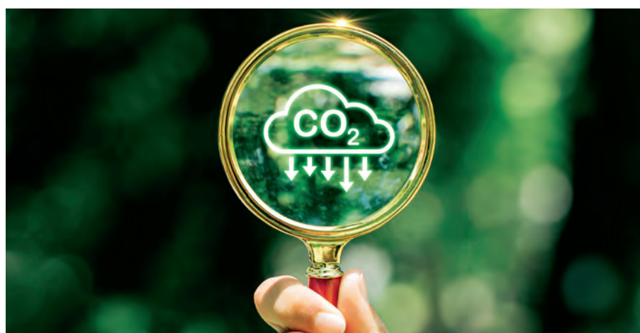
Carbon-Management-Ansätze sind kein Ersatz für drastische Emissionsreduktionen. Vielmehr stellen sie eine zusätzliche Herausforderung dar, um das Klimaziel zu erreichen

Auf europäischer Ebene zeugen neue Initiativen der Europäischen Kommission wie der Net Zero Industry Act , die Zertifizierung von CO 2 -Entnahmen oder die Diskussionen über das 2040-Klimaziel von der Dynamik. In Deutschland sind es vor allem die angekündigte Novellierung des deutschen Klimaschutzgesetzes und die Erarbeitung von Strategien zum Carbon Management und zum Umgang mit unvermeidbaren Restemissionen, die das neue Engagement in dieser Sache verdeutlichen.